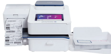
SendPro® C 220+ / SendPro® C 320+