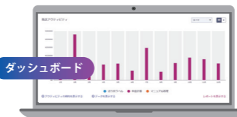
郵送費用や使用状況をひと目で把握

期間別や部門別の使用状況がダッシュボードで一目で把握でき、数値管理やコスト分析もスムーズに。