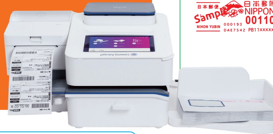
SendPro® C220+ / SendPro® C320+