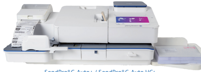
SendPro® C Auto+ / SendPro® C Auto HC+